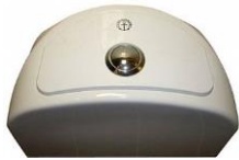
2-skylsmodeller med rund 2-delt knap