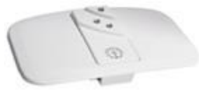
Gustavsberg Nordic duo